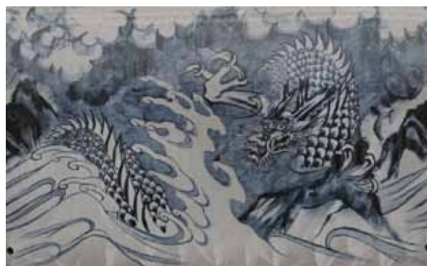
◀撮影風景 ▲展開写真の例