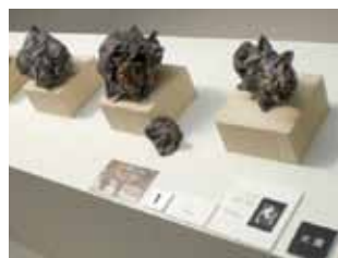
▲ OB 展の様子