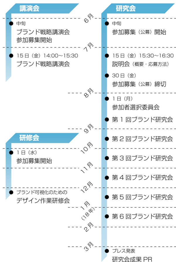
▲ 年間スケジュール